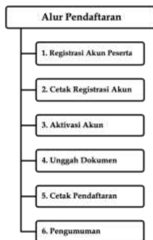
Bagan 1 Alur Pendaftaran