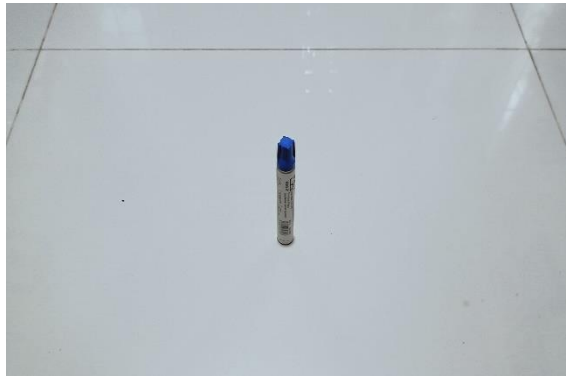
Gambar 3. Ilustrasi Benda Tanpa Bayangan