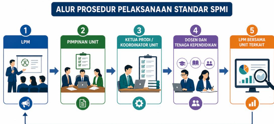
Gambar 2. Prosedur Pelaksanaan Standar SPMI

menjadi pondasi utama bagi proses evaluasi, pengendalian, dan peningkatan standar secara berkelanjutan, sehingga visi institusi untuk mencapai keunggulan akademik dan tata kelola yang baik dapat terwujud secara nyata.